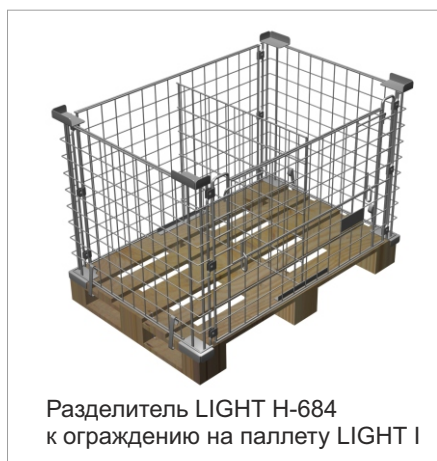
Разделитель LIGHT H-684 к ограждению на паллету LIGHT I