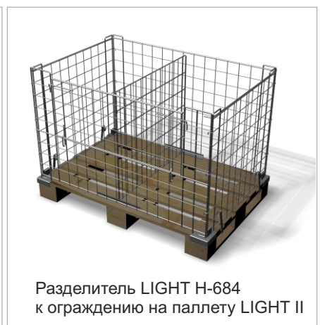
Разделитель LIGHT H-684 к ограждению на паллету LIGHT II