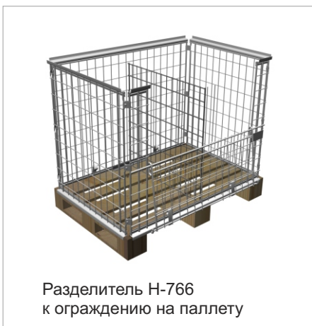
Разделитель H-766 к ограждению на паллету