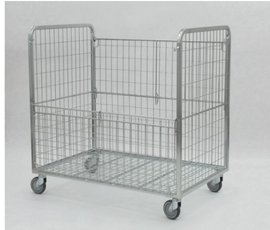
Nie używane kontenery można złożyć do połowy wysokości i nastawić na siebie: