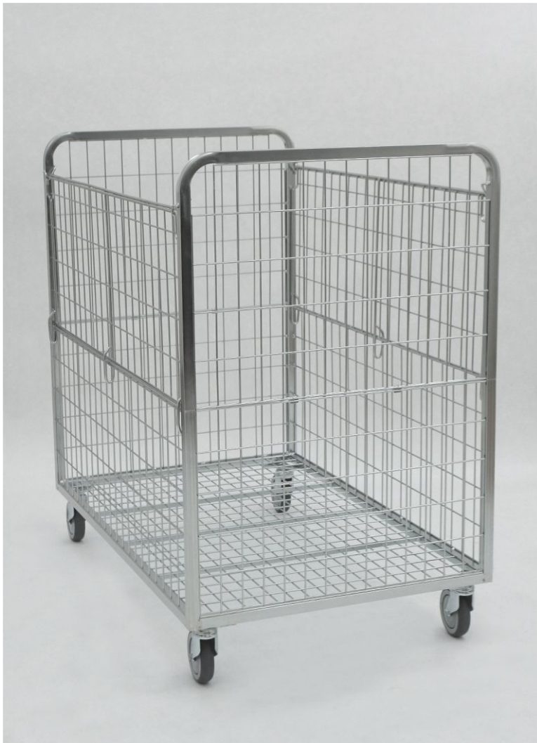
Uchylnie klapy w kontenerze: