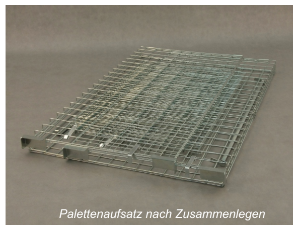
Palettenaufsatz nach Zusammenlegen