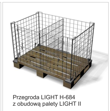
Przegroda LIGHT H-684 z obudową palety LIGHT II