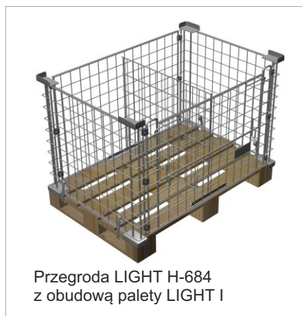
Przegroda LIGHT H-684 z obudową palety LIGHT I