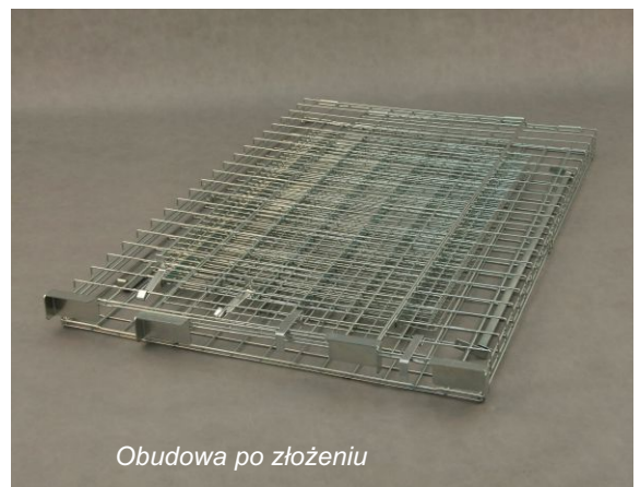
Obudowa po złożeniu