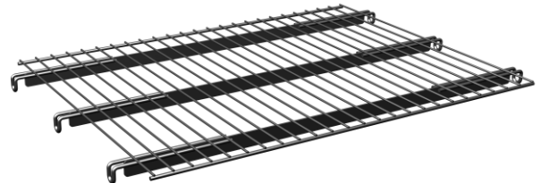
półka z drucianymi zaczepami wzmocniona płaskownikami

Stół wykonany z kształtowników; siatki i przegroda z prętów stalowych. Dno wykonane z prętów stalowych wzmocnione płaskownikami, złożone z dwóch części. Stół posiada możliwość regulacji wysokości dna na dwóch różnych poziomach jednocześnie. Podstawa i boki są połączone ze sobą w całość z możliwością dogodnego złożenia i rozłożenia stołu.