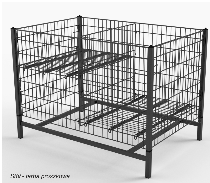
Stół - farba proszkowa