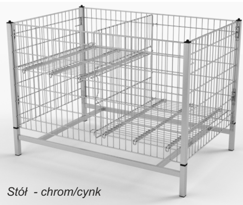
Stół - chrom/cynk

Stoły ekspozycyjne umożliwiają prezentację małych, nieporęcznych towarów. Konstrukcja zapewnia dużą stabilność i wysoką odporność na uszkodzenia. Dno wzmocnione płaskownikami umożliwia prezentację towarów o różnych gabarytach i ciężarze. Stół posiada możliwość regulacji wysokości dna na dwóch różnych poziomach jednocześnie. Przegroda i dno podzielone na dwie odrębne części umożliwiają ekspozycję różnego typu asortymentu w tym samym czasie. Konstrukcja stołu pozwala na jego szybkie i proste składanie i rozkładanie. Nieużywane stoły można złożyć i ułożyć jeden na drugim, dzięki czemu zajmują bardzo mało miejsca.