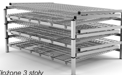
Złożone 3 stoły